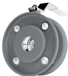
КРАН ШАРОВОЙ LD СТРИЖ СТАЛЬ 20 межфланцевое соединение